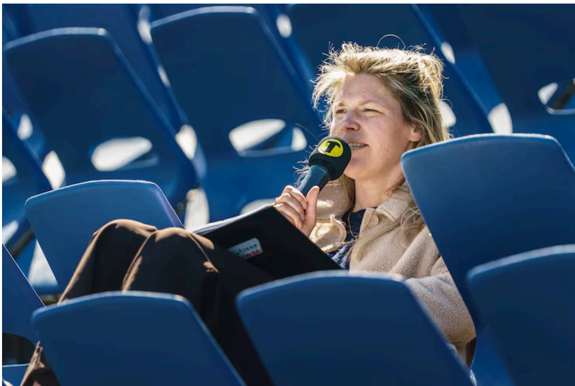
Regisseur Tatiana Pratley geeft aanwijzingen vanaf de tijdelijke tribune naast het zwembad.

“In elke fase is er een andere verhouding met het water”, licht Pratley toe. In Swimbad staan vrouwenlevens centraal. Er zijn volgens haar al genoeg toneelstukken over mannenlevens. “Een vrouwenleven is heel rijk en kent diverse fases. En ik ben zelf vrouw. Maar het is niet zo dat dit stuk alleen over vrouwen gaat.”