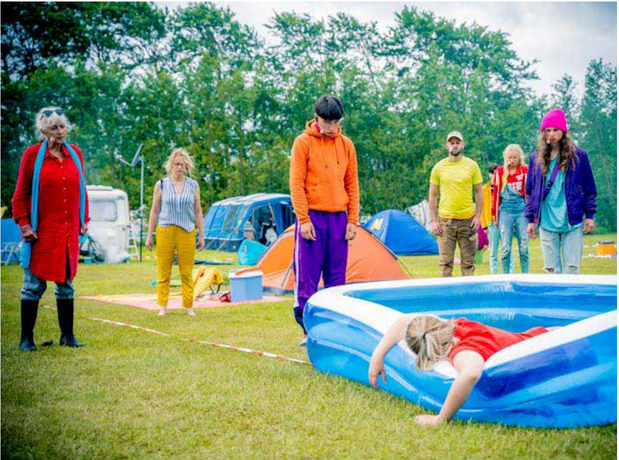
Part-Time Paradise , co-productie Skoft&Skiep en Tryater (2019)