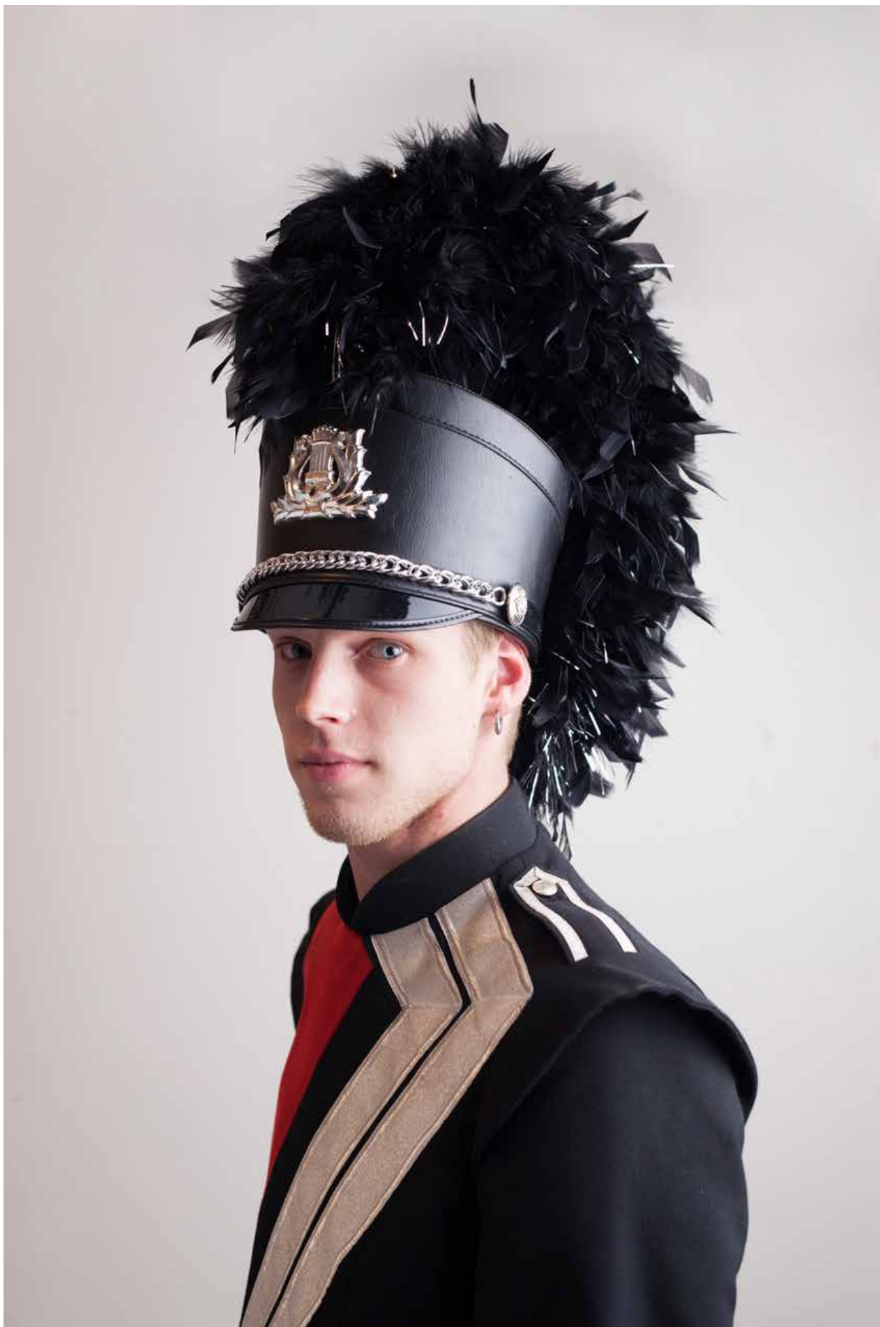
Fanfare (2023)