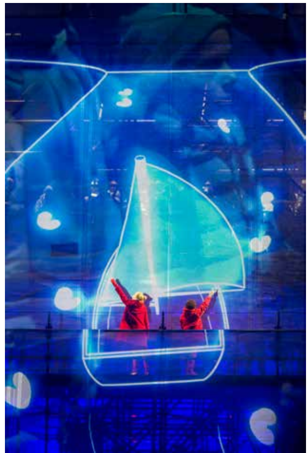
Opening van Leeuwarden-Fryslân Culturele Hoofdstad 2018, co-regie Judkovskaja en Pratley