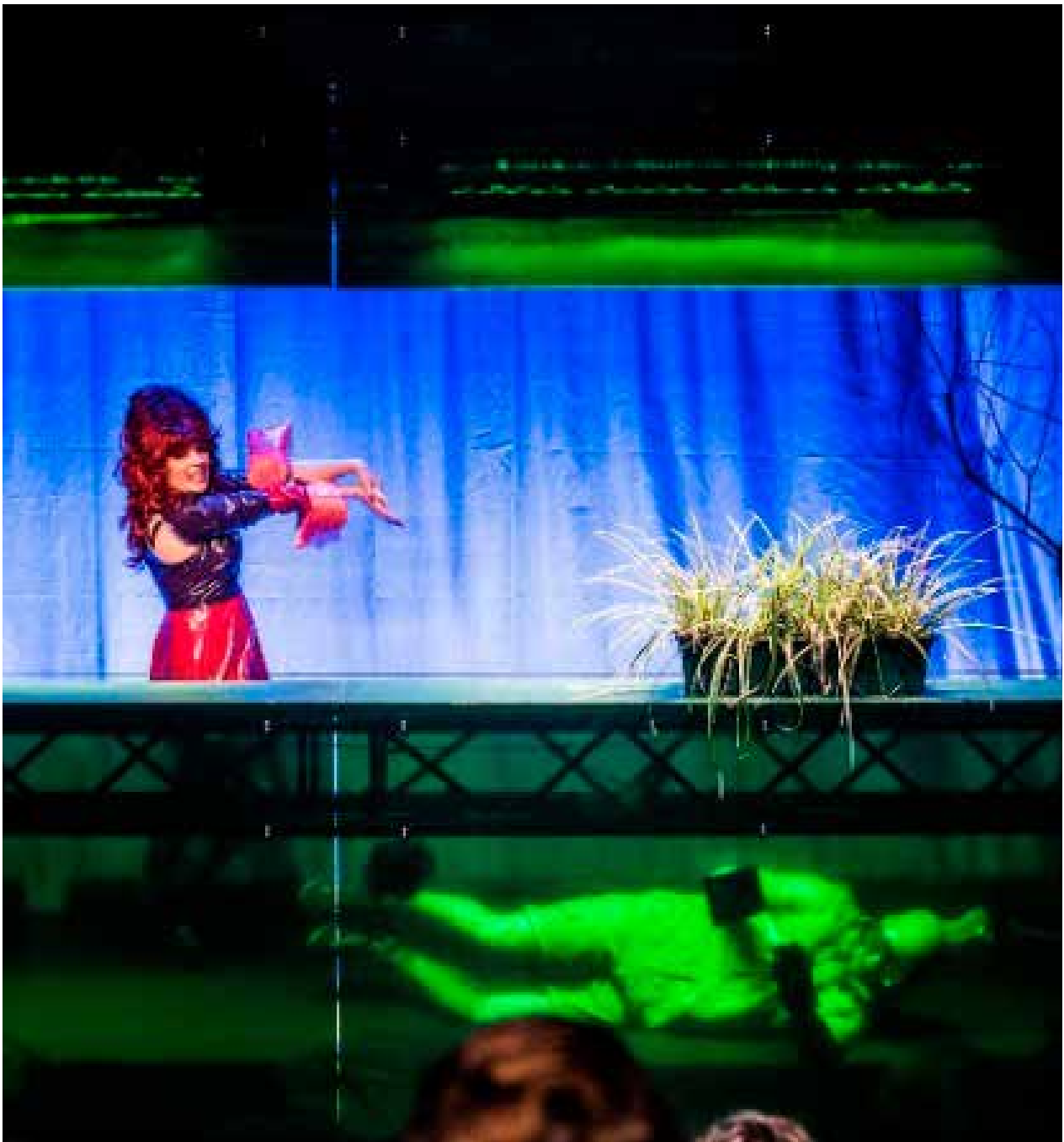
Ien dei út it knisterjende libben fan in pûdsje (4+) regie: Karlijn Kistemaker (2017)