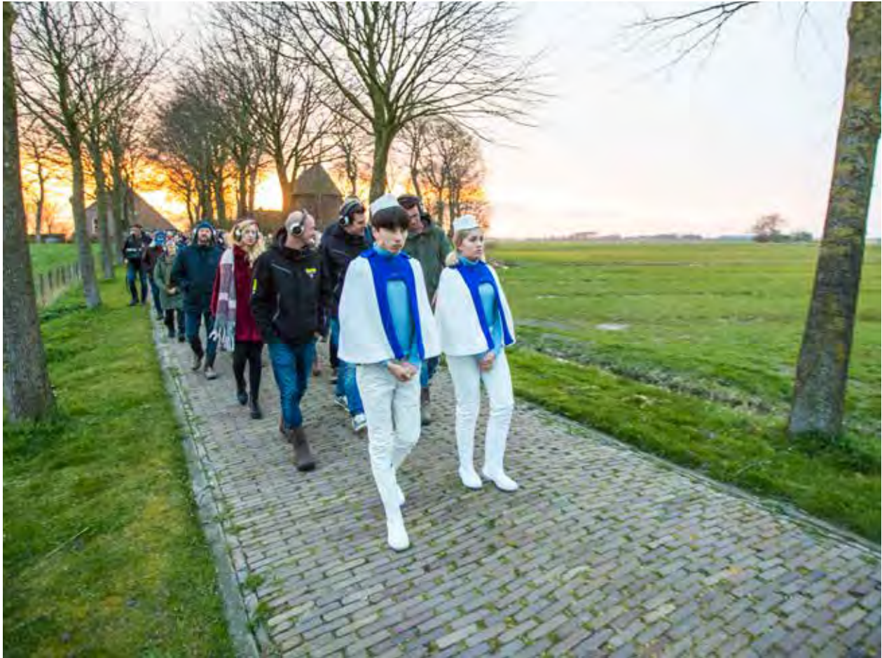
Hjir ha ik west: een nostalgische trip naar de toekomst van het platteland (2019)

Pratley werkt voor de invulling van het activiteitenplan samen met een groep van makers en performers wier artistieke signatuur goed aansluit bij de koers die zij voor 2021-2024 heeft uitgezet. Zij worden voorgesteld onder 'activiteiten 2021-2024'.