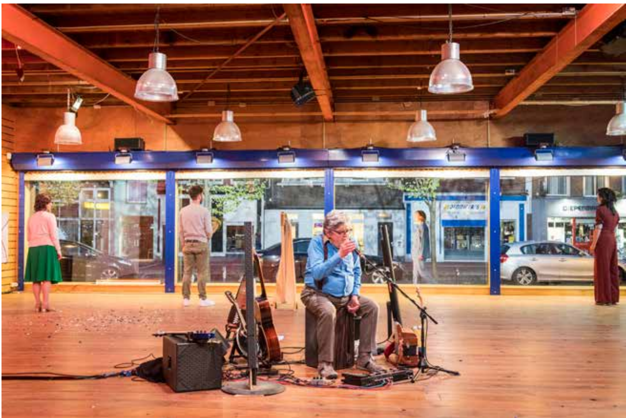
Doarp Europa en Wereldburgers van de Voorstreek , regie Ira Judkovskaja (2018)