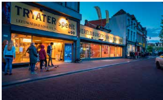
Publiek bij presentatie interne opleiding