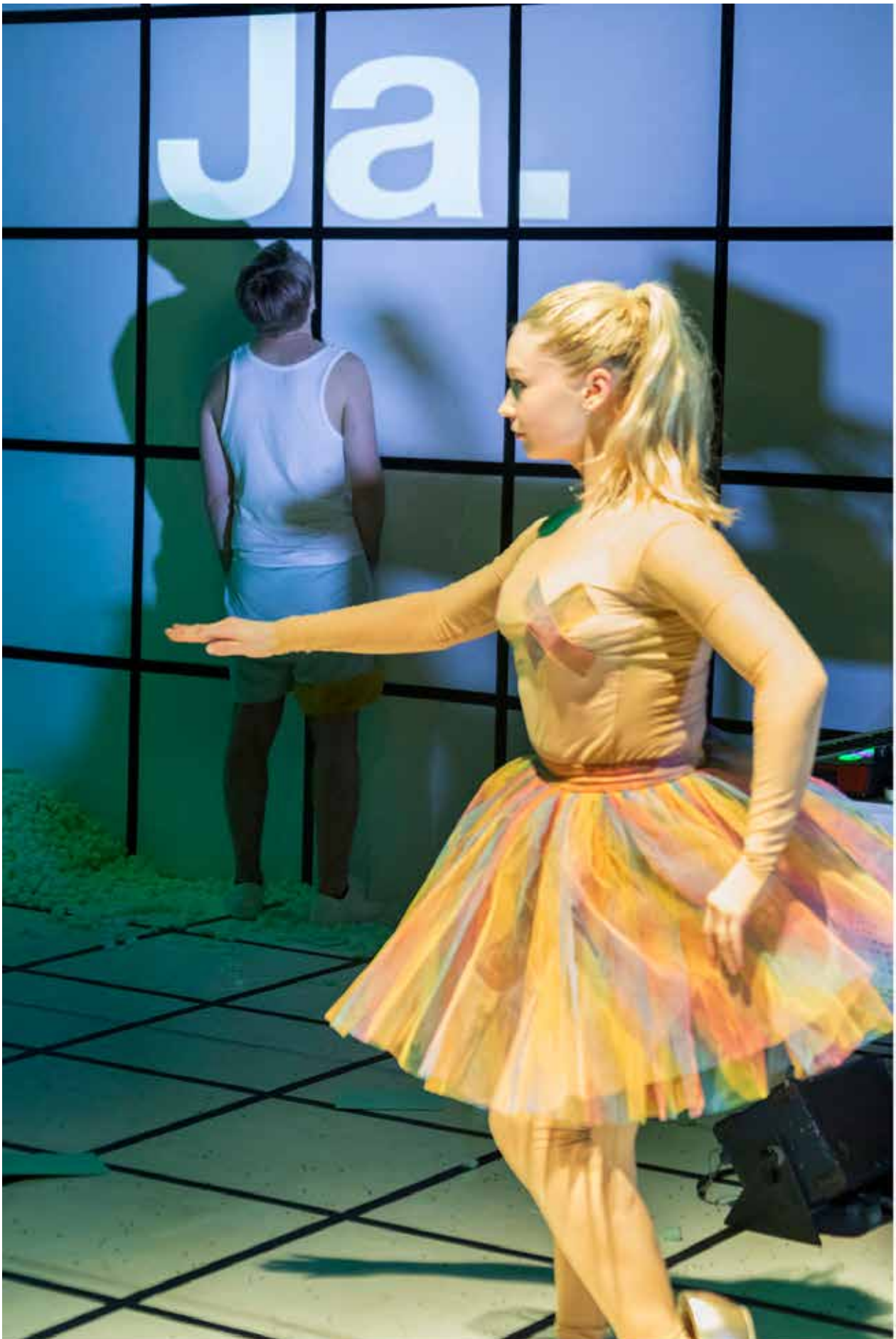
Karawane (2018)